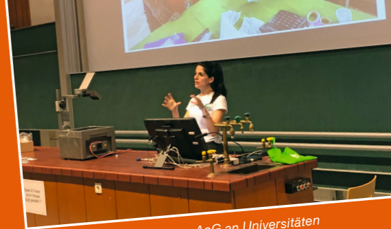
Vorträge über die Arbeit von AoG an Universitäten und bei Veranstaltungen, um Apotheker ohne Grenzen bekannter zu machen