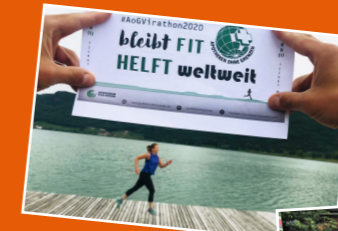
Aktionen rund um AoG: der erste AoG-Virathon – organisiert von der AoG-Regionalgruppe Leipzig