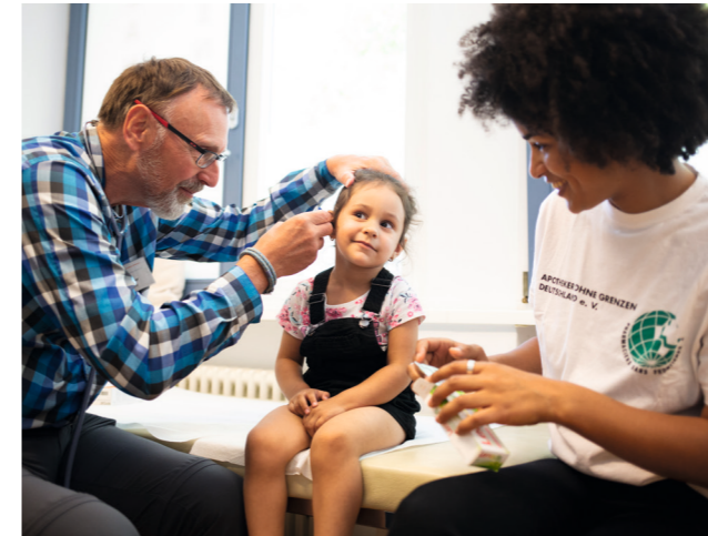
Auch in drei deutschen AoG-Projekten in Berlin, Mainz und Frankfurt sind wir aktiv.