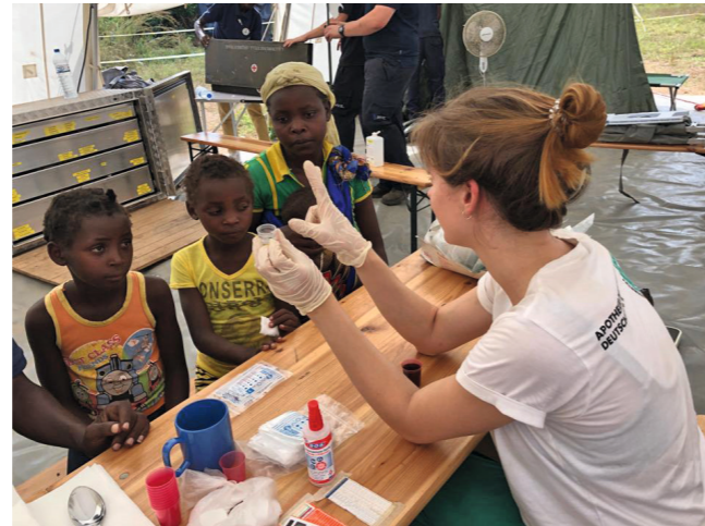
Beim Nothilfeinsatz in Mosambik 2019 waren viele AoG-Einsatzkräfte vor Ort.